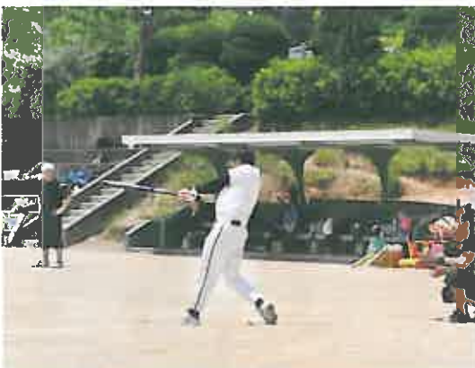
当グループが事務局機能を担いました