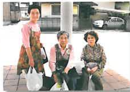
買い物の後は井戸端会議？