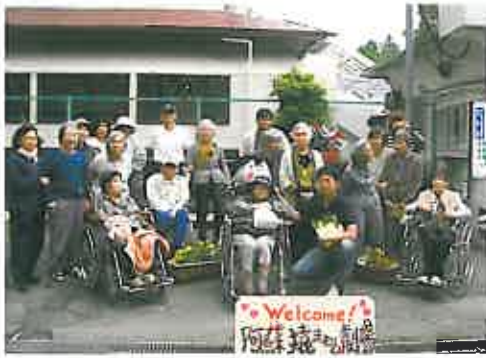
来ところ思ご田を園日記録撮影