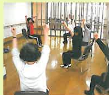
月曜日の「健康教室」風景