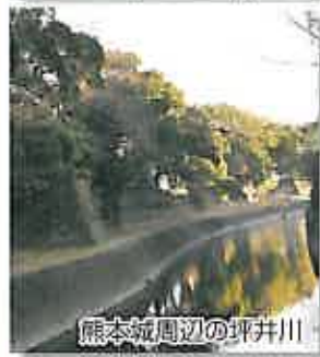
熊本城周辺の埤井川

熊本市花園2丁目の高台に建つ「八角堂」は、日蓮宗の 名刹・本妙寺参道の仁王門の横。産交バス「本妙寺」バス停 から200m、市電電停へは600mの距離。JR上熊本駅にも近 く、交通アクセスは良好です。本妙寺は、熊本城・築城や河 川改修などの治水に業績があった藩主・加藤清正公が祀 られ、毎年7月23日前後には参拝客で賑わいます。