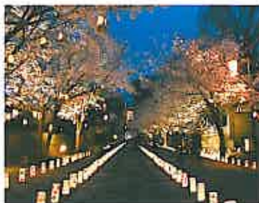
幻想的な夜桜の風景