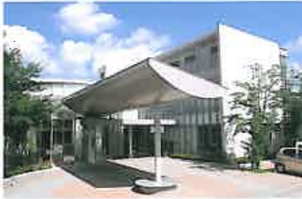
メディカルケアセンター ファイン リハビリ病棟のほか緩和ケア病棟

ピュア・サポートグループは 医療法人社団 大浦会を中心とした 医療・福祉グループです。 社会福祉法人 照敬会もその一員です。