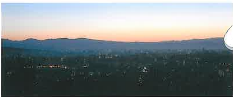
明日が昇る直前の市街地の眺め