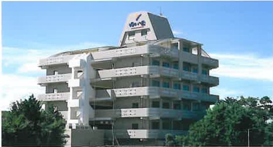
ケアハウス ゆいの家