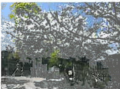
本妙寺参道には桜並木が続きます