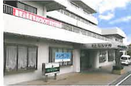
介護老人保健施設 おとなの学校 本校 くもん学習療法を導入し、学校形式のリハビリを提供